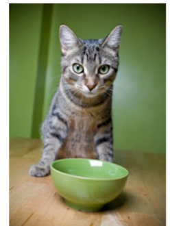
Första steget är att sluta med fri tillgång.

© 2015 Feline Nutrition Foundation Ver 1.2