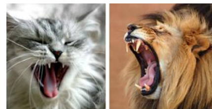
Kleine of grote kat, dit zijn de tanden en kaken van een roofdier.

Kijk eens goed naar het gebit van je kat. Dan zie je kaken en tanden die ontworpen zijn om prooivlees te eten. Lange, scherpe snijtanden om het prooidier te grijpen, te verankeren en te doden. Hun messcherpe tanden aan beide zijden van de kaak gaan door huid, vlees en bot. Katten kauwen namelijk niet op eenzelfde manier zoals plantetende dieren doen. Hun kaken bewegen niet van links naar rechts. Evenmin hebben katten kiezen om hun eten te vermalen. Katten gebruiken hun snijtanden om het vlees in kleine stukjes te snijden om deze vervolgens door te slikken.