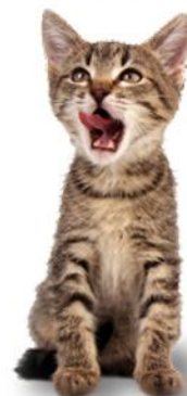
Kattungar tar sig an rå mat som fisken i vattnet.

Medlemskap i Feline Nutrition är gratis. Lär dig mer om hur du kan bli en del av ändringen av hur katter utfodras. För mer information, besök