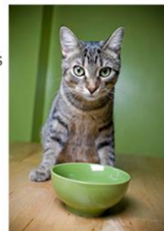
Första steget är att sluta med fri tillgång.

Det första steget är att sluta med fri tillgång. Inför regelbundna måltider. Introducera proteinrikt blötfoder tillsammans med torrfodret för att vänja katten vid en mjukare konsistens. Lämna maten framme i en halvtimme, ta sedan bort den. Din katt kan utan problem ha 8-12 timmar mellan måltiderna. Det är naturligt i det vilda. Att vara lite hungrig vid middagsdags gör katten mer villig att prova ny mat. Klappa katten samtidigt som den äter, och handmata lite. Toppa med torrfodermuta ovanpå blötmaten för att uppmuntra ätande. Fortsätt erbjuda blötfoder vid varje måltid, oavsett hur lång tid det tar. Så småningom kommer katten övertygas, och du kan successivt minska givan med torrfoder vid varje mål.