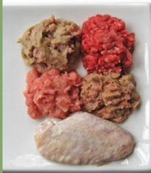
Eine Auswahl von gewolfstem Rohfutter und zerkleinerten Stücken samt Knochen.

Katzen haben die Fähigkeit verloren, Kohlenhydrate gut zu verwerten. Übermäßig viele Kohlenhydrate im Futter, vor allem Getreide, können zu Fettleibigkeit, Diabetes und schweren Verdauungsstörungen führen. Katzen stillen ihren Energiebedarf hauptsächlich aus Glukose, die in ihrer Leber aus Protein gebildet wird, nicht aus Kohlenhydraten. Katzen haben sich als Wüstenbewohner entwickelt, daher haben sie von Natur aus kaum Durstempfinden. Werden sie mit trockenen Körnchen gefüttert, können sie chronisch austrocknen und haben ein erhöhtes Risiko für Erkrankungen der Harnwege und der Nieren. Trockenfutter hat einen Feuchtigkeitsgehalt von etwa zehn Prozent, und trockenfütterernährte Katzen erhalten, auch wenn sie Wasser trinken, nur rund die Hälfte der Flüssigkeitsmenge, die sie bei Dosen- oder Rohfutter mit 60 bis 70 Prozent Feuchtigkeitsgehalt aufnehmen.