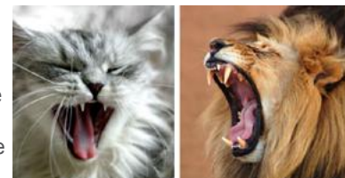
Gato o gran felino, son los dientes y mandíbulas de un depredador.

Sus mandíbulas no tienen movilidad lateral, y no poseen molares planos para desmenuzar la comida. Utilizan sus dientes laterales sólo para cortar la comida en trozos lo suficientemente pequeños para tragarlos.