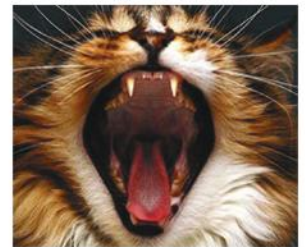
ドライフードは歯をきれいにするわけではない。

ドライフードの水分含量は10%以下です。猫にとっての自然な獲物であるネズミの体内に含まれる水分が65～75%であることを考えてみましょう。猫は体にとって必要な水分を新鮮な生の食べ物から摂取するようにできているわけですから、本来なら水を飲まなければならなくなることは殆どないのです。食事及び飲み水から摂取する水分を全て合わせても、ドライフードを食べている猫は、缶フードを食べている猫に比べて、半分以下の水分しか摂取できていません。この慢性的な脱水状態により、尿が過剰に濃縮され、その結果尿管障害につながります。