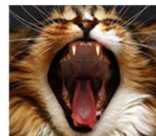
Torrfoder rengör inte våra katters tänder.

Kolhydrater anses vanligtvis vara energirikt men kattdjur använder protein och fett för att täcka sitt energibehov och har en begränsad förmåga att spjälka kolhydrater. Kattens naturliga kost - gnagare, kaniner, insekter och fåglar - innehåller mindre än 2% kolhydrater. Den överdrivna mängden kolhydrater i torrfoder främjar fetma hos katterna och har också en roll i diabetes.